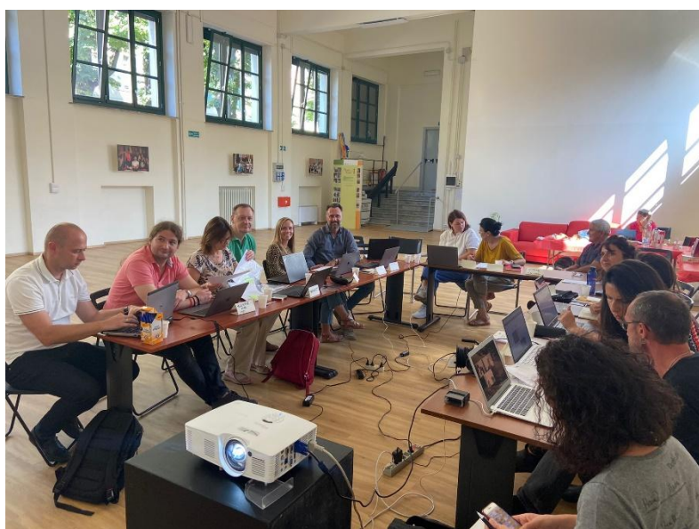
L'ULTIMO MEETING TRANSNAZIONALE A TORINO, ITALIA

Il Meeting ha dato modo alla partnership discutere gli ultimi dettagli del progetto che sta per concludersi. Tra gli aspetti più rilevanti affrontati anche le attività di disseminazione realizzate nel corso del progetto.